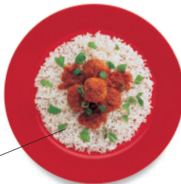
el arroz rice