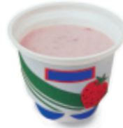
el yogur yo-GOOR yogurt