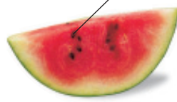
la sandía sahn-DEE-ah watermelon