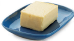
la mantequilla mahn-teh-KEE-yah butter

Me gusta el pan con miel. I like bread with honey.