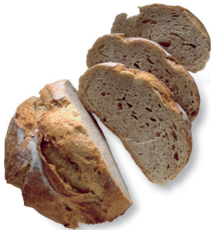
el pan pahn bread

Me gusta el pan con miel. I like bread with honey.