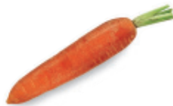
la zanahoria than-nah-O-ree-yah carrot