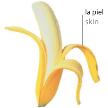
el plátano PLAH-tah-no banana