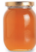
la miel mee-ELL honey