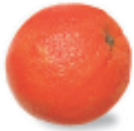
la naranja nah-RAHN-Hah orange