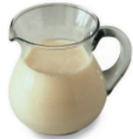
la leche LEH-cheh milk