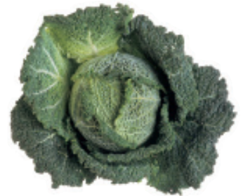
el repollo reh-PO-yo cabbage

Estamos comiendo pasta. We're eating pasta.