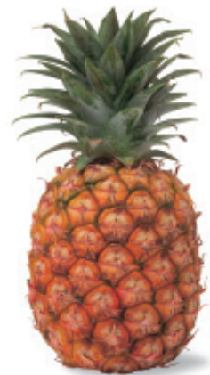
la piña PEE-n'yah pineapple

Una piña es una fruta. A pineapple is a fruit.