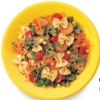
la pasta PAHS-tah pasta