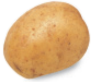
la patata pah-TAH-tah potato