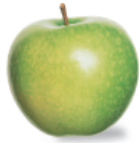
la manzana mahn-THAH-nah apple