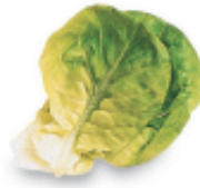
la lechuga leh-CHOO-gah lettuce