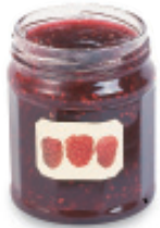
la mermelada mair-meh-LAH-dah jelly